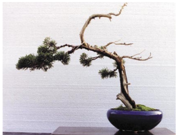
2. Y lo compré. Su primer modelado, fue en estilo Fukinagashi (azotado por el viento); era la posibilidad más obvia, y seguramente la que más encajaba con mi gusto de aquella época. El árbol tenía mucho movimiento, pero pronto empezaron a hacerse evidentes todos sus defectos: la delgadez de su tronco y su falta de interés, la dispersión de ramas y Jins... Esta fotografía corresponde a 1990.