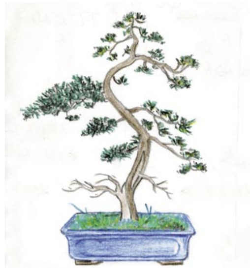
1. En 1989, y con el aspecto que he intentado reproducir en el dibujo, este Juniperus chinensis estaba condenado a languidecer hasta morir, sobre un banco del vivero a donde había ido a parar. Algunas ramas bajas ya se habían secado; otras, a derecha y en el ápice, iban por el mismo camino; sólo unas pocas (especialmente una de la izquierda, cercana al último tercio del árbol) se mantenían todavía con algo de vigor. Evidentemente, nadie iba a comprar un bonsái moribundo, así es que la cantidad que me pidió el viverista por él, compensaba, sobradamente, el riesgo de que el árbol no sobreviviera.

De su evolución tengo numerosas fotografías, pero, para no cansarte, he escogido sólo algunas, suficientes como para que puedas hacerte una idea de los cambios importantes realizados durante todos estos años. A través de estas fotografías, y de los pequeños comentarios que las acompañan, podrán seguir algo de la historia de este bonsái y, por extensión, de mi relación con este arte.